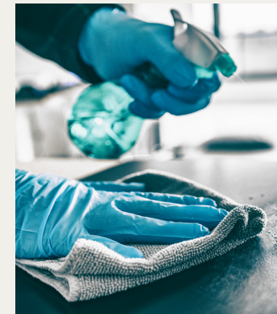
Entretien et Hygiène professionnels